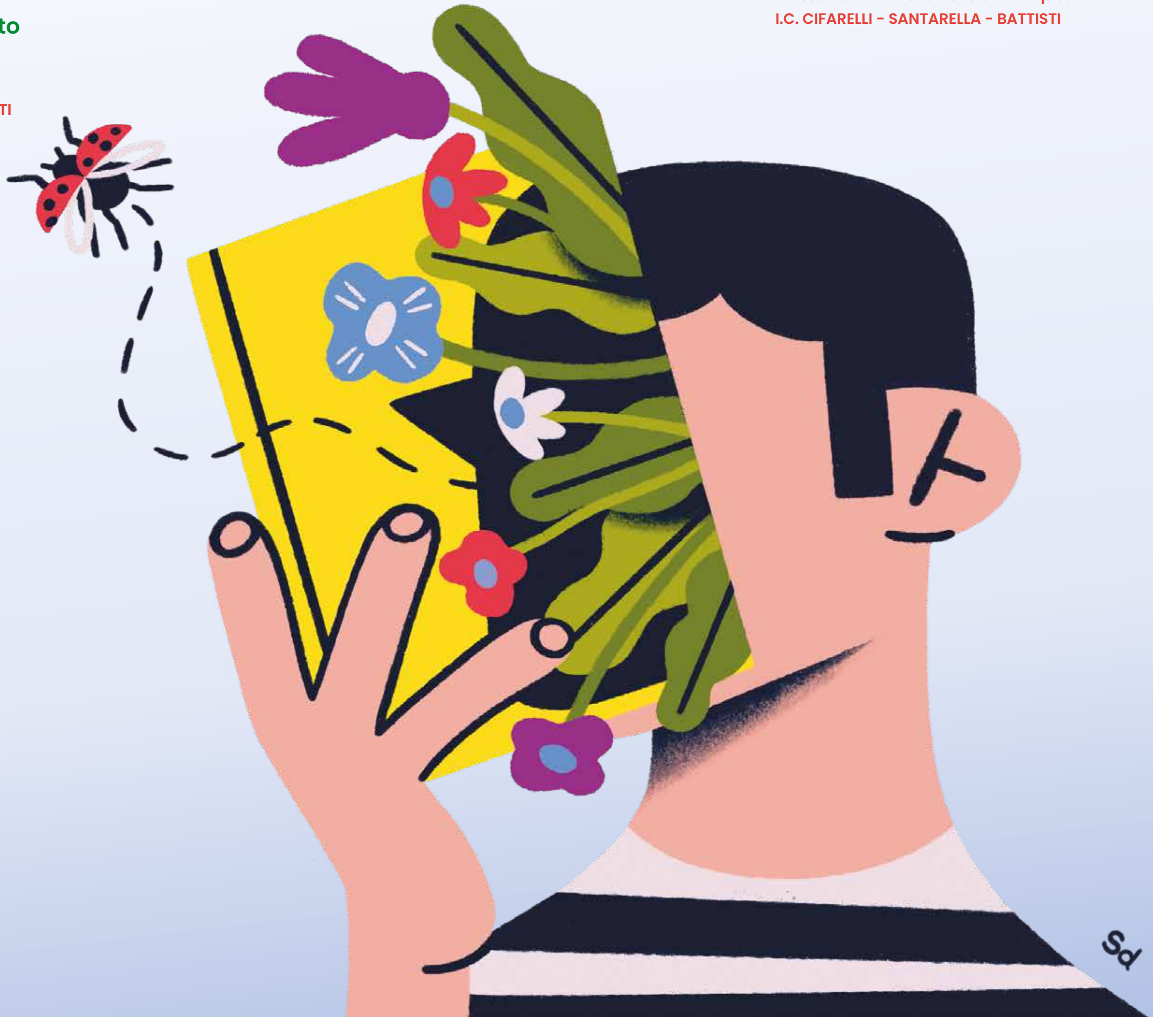
Illustrazione di Stefano Dorigo in collaborazione con Romics

Attività di lettura animata Presso Cortili e Biblioteche dei vari plessi I.C. CIFARELLI - SANTARELLA - BATTISTI