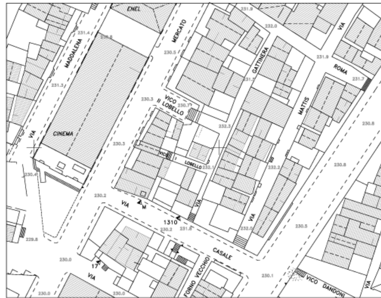
planimetria dello stato di fatto

D1.03 34p RAPP. 1:200 ISOLATO 46 ISOLATO 48 EDILIZIA DAL XVIII AL XIX SECOLO ISOLATO 48 EDILIZIA FINO AL XVII SECOLO