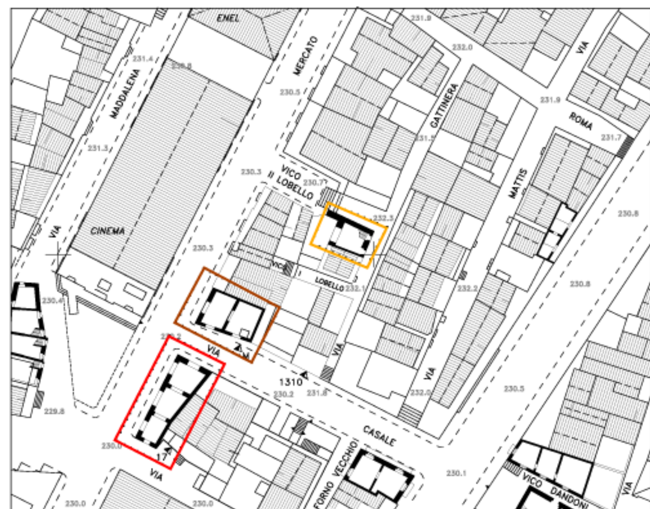
planimetria dello stato di progetto