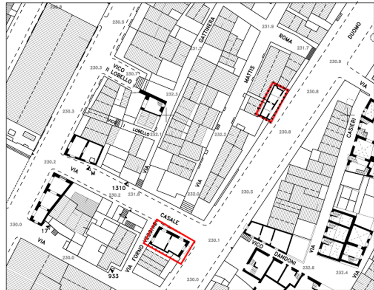
planimetria dello stato di progetto